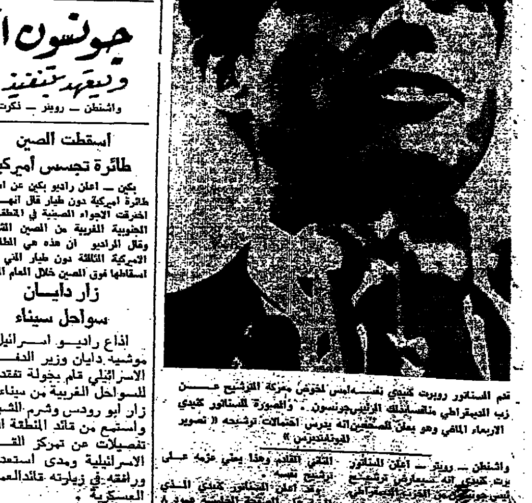
والشطن - رويتر - اعلان للسناتور الذي القام وهذا يعني فوزه على بيت كسدي انه سيعارض ترشيح جونسون . في وقت مبكر من اليوم في واشنطن . في وقت مبكر من اليوم في واشنطن . البقية على الصفحة الرابعة عمود ٢

بيروت - صرح السيد فواد بطرس وزير خارجية لبنان بانه سيجمع اليوم بالسيد محمود رياض وزير خارجية الجمهورية العربية المتحدة لدى مورده بيروت فلندا الى القاهرة بعد اختتام زيارته لتركيا . وقال الوزير اللبناني انه سينتاه مع السيد رياض حول تطورات الوضع العربي وقد مؤتمر وزراء الخارجية العرب . واعرب السيد بطرس عن امله في ان يتناول قريبا موعد انعقاد مؤتمر القمة العربي على اثر الجهود التي بذلها بعض الدول العربية للتحول على موافقة السعودية وسورية حتى يعقد المؤتمر بحضور جمع المنسوك والروساء العرب .